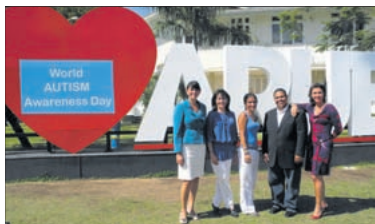
Minister Michelle Hooyboer Winklaar, hunto cu miembronan Fundacion Autismo Aruba.

ORANJESTAD--E landmark 'I love Aruba' tambe tabata den luz di Dia Mundial di Consientisacion riba Autismo ayera. For di merdia a pone e letranan 'World Autism Awareness Day,' WAAD pa asina tur hende na Aruba, incluso e miles di turistanan crucero para keto riba e dia aki. Ministernan tambe a probecha di e oportunidad pa sostene e trabou di Fundacion Autismo Aruba cu a ricibi cooperacion di e operadonan di 'I Love Aruba' pa e dia aki cu ta asina crucial pa consientisacion na nivel nacional. Autismo ta un estorbo den desaroyo neurologico cu ta afecta particularmente e area di comunicacion.